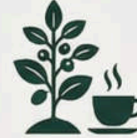
Saudi Coffee Company