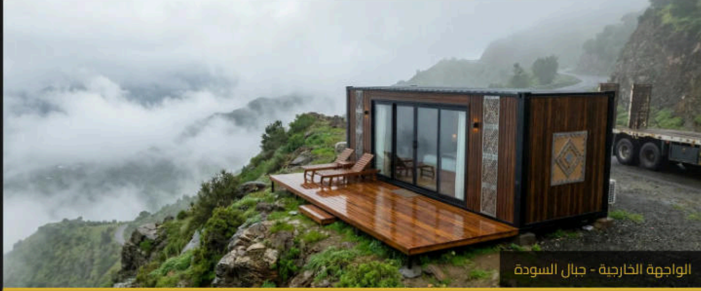
الواجهة الخارجية - جبال السوداء

تحفة هندسية مستوحاة من العمارة النجدية، توفر مساحة معيشة متكاملة وفاخرة. يتميز الكونتینر بدمج المساحات الداخلية مع الطبيعة الخارجية عبر واجهات زجاجية بانورامية وشرفة مدمجة.