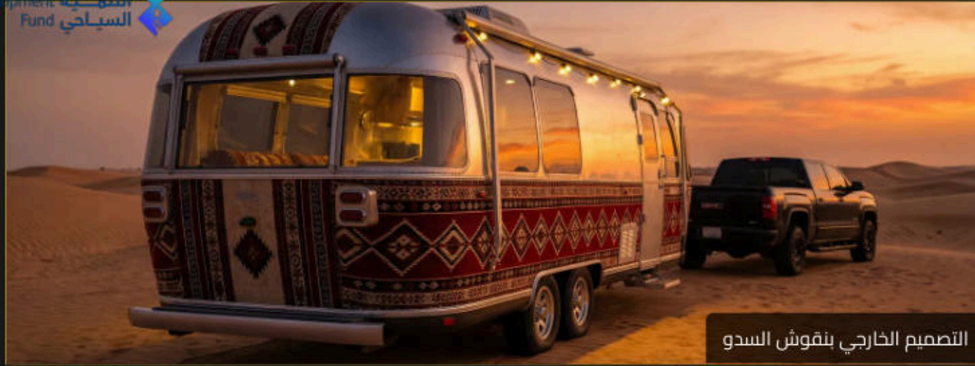
التصميم الخارجي بنقوش السدو