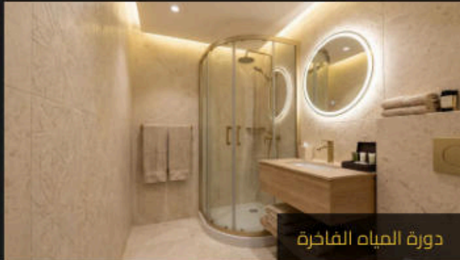
دورة المياه الفاخرة

الداخل: صالة معيشة، مطبخ صغير، حمام فاخر