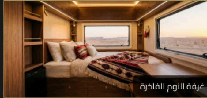
غرفة النوم الفاخرة