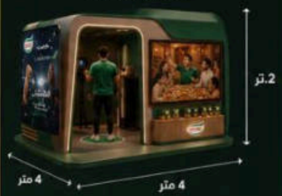
المساحة قابلة للتعديل حسب موقع المول